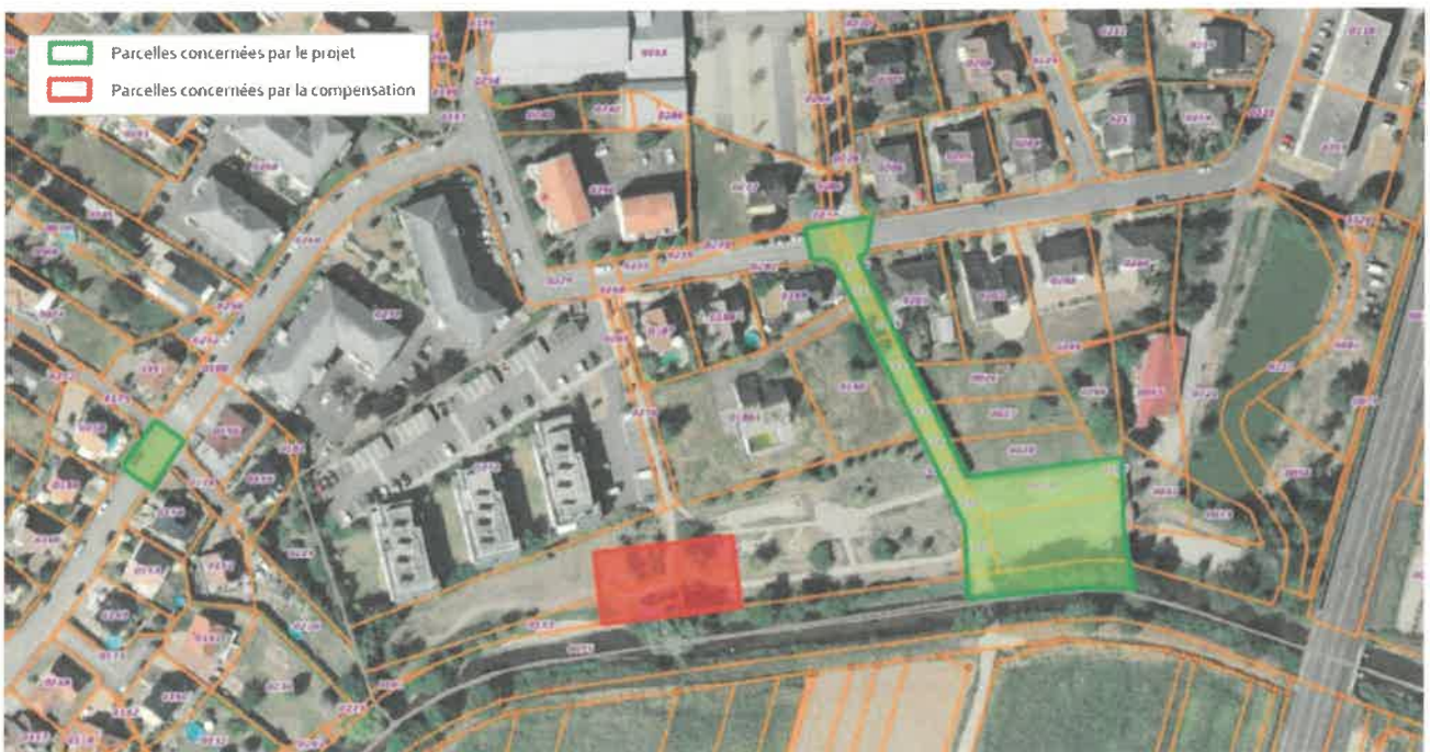
Figure 2 : Parcelles concernées par le projet