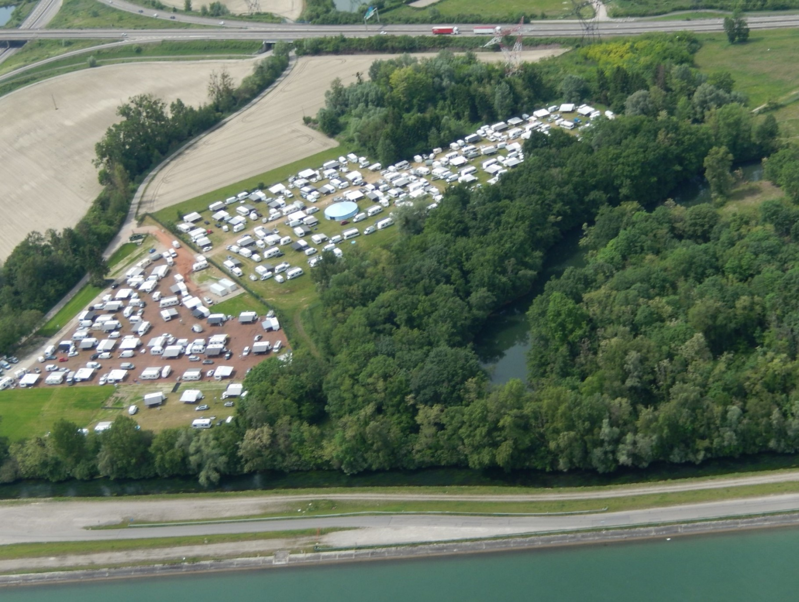
SCHÉMA DÉPARTEMENTAL D'ACCUEIL DES GENS DU VOYAGE