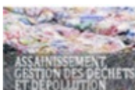
Sanest (Strasbourg) Collecte et traitement des eaux usées