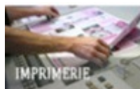
Valblor (Strasbourg) Imprimerie