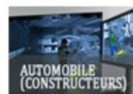
PSA Peugeot Citroën (Mulhouse) Constructeur automobile