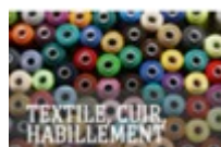
De Fil en Aiguille (Thann) Fabrication d'autres vêtements et accessoires