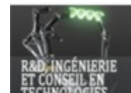
Altran Lab (Illkirch) Ingénierie, études techniques