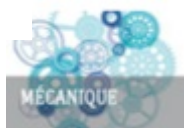
Schaeffler France (Haguenau) Mécanique industrielle