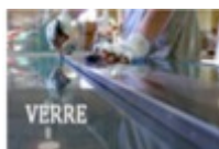
Euroglas (Hombourg) Fabrication de verre plat