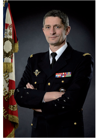
GÉNÉRAL D'ARMÉE DENIS FAVIER DIRECTEUR GÉNÉRAL DE LA GENDARMERIE NATIONALE

La prévention est un outil majeur de la gendarmerie face à cette menace. Elle est ciblée sur les personnes les plus vulnérables et notamment les mineurs. Face à la diversité des menaces, les actions de sensibilisation doivent appréhender l'ensemble du spectre de cette nouvelle délinquance afin d'être efficaces. Créées en 1997, 43 brigades de prévention de la délinquance juvénile (BPDJ) déployées sur l'ensemble du territoire sont chargées de mettre en œuvre des actions de prévention auprès des mineurs au sein des établissements scolaires. Face à l'accroissement de la cyberdélinquance, ces unités effectuent depuis déjà de nombreuses années des séances de sensibilisation aux dangers d'Internet. L'engagement de la gendarmerie dans l'opération Permis Internet pour les enfants conforte sa position d'acteur majeur dans la lutte contre la cyberdélinquance, et confirme sa présence sur tout le spectre de la cybermenace.